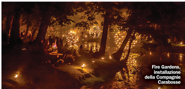
Fire Gardens, installazione della Compagnie Carabosse